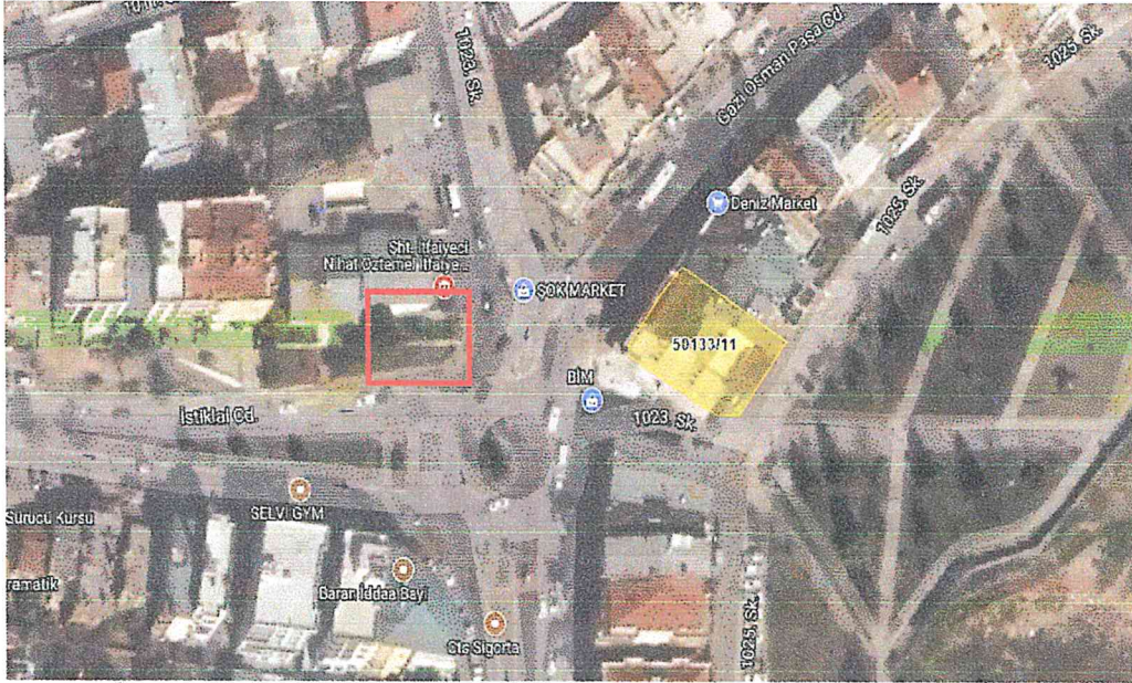
Şekil 1: İmar Planı Değişikliği Alanının Uydu Görüntüsü

İmar Planı Değişikliğinin amacı, çevresindeki yerleşim birimlerinin enerji altyapısındaki eksikliğin giderilmesi için güncel imar planları üzerine trafo gösteriminin yapılmasıdır.