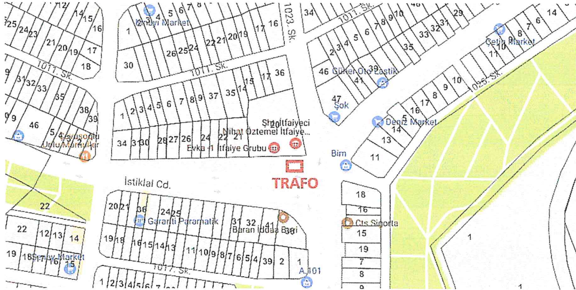
Şekil 3: Mülkiyet Durumu

Tüm yerleşmelerde olduğu gibi, gelişen teknoloji ve gereksinimler doğrultusunda ana enerji dağıtımını yetersiz kalmaktadır. Enerji dağılımının sağlıklı yapılabilmesi ve AG-YG Elektrik Tesisini sağlamak amacı ile rapor ekinde yer alan plan değişikliği paftası sunulmuştur.